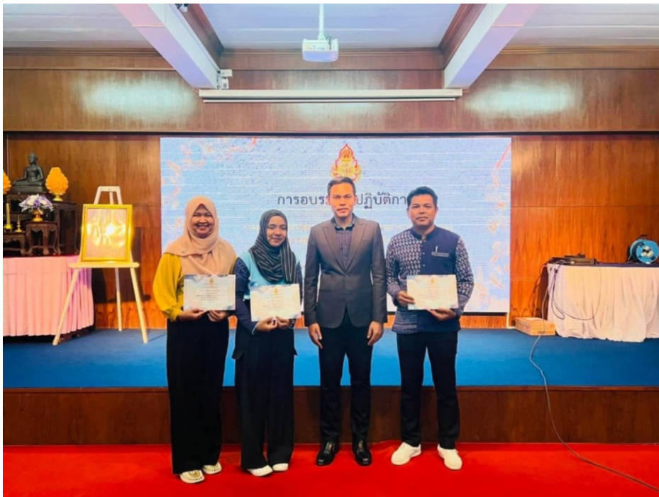
อบรมเชิงปฏิบัติการ การเขียนแผนการจัดการเรียนรู้ด้วยกระบวนการ Active Learning ศูนย์ส่งเสริมทักษะศตวรรษที่ ๒๑